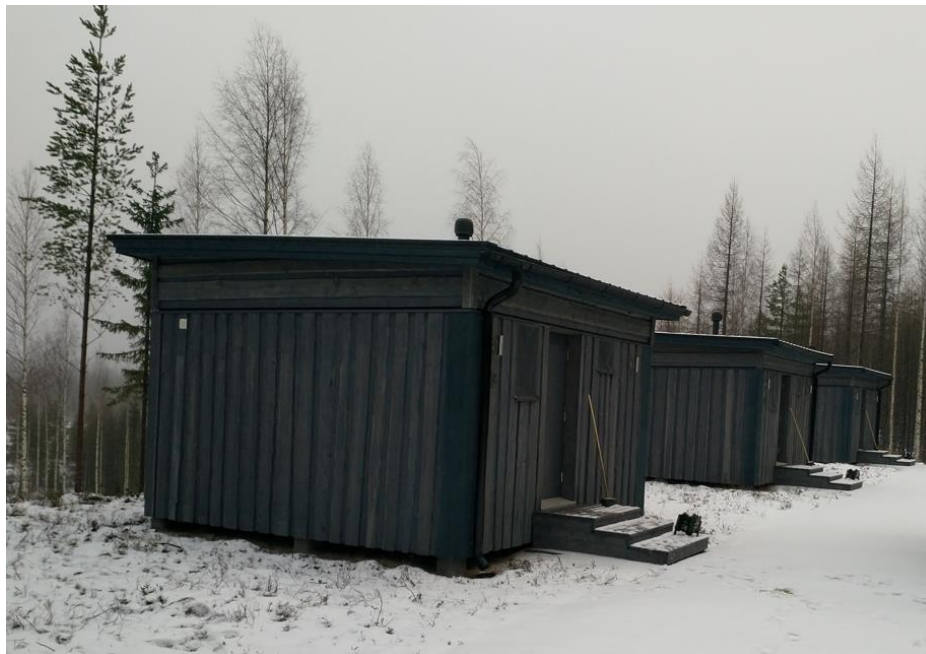
Kuva 9. Karhunkatselumökkejä