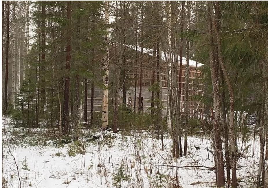
Kuva 8. Rakenteilla oleva lämpökeskus