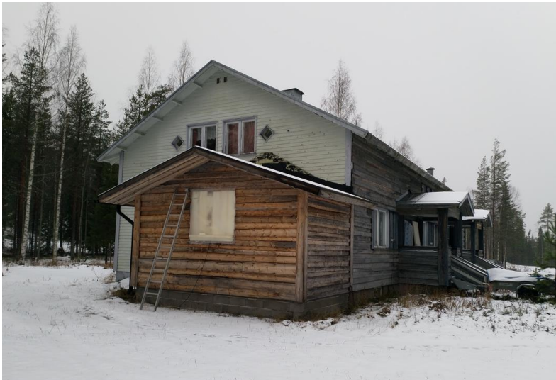
Kuva 4. Majoitusrakennus (Rajavartiolaitoksen tukikohdan päärakennus)

Matkailuyrityksen päärakennukset ovat Rajavartiolaitoksen vanha tukikohdan rakennuksia, jotka on uudelleen verhoiltu.