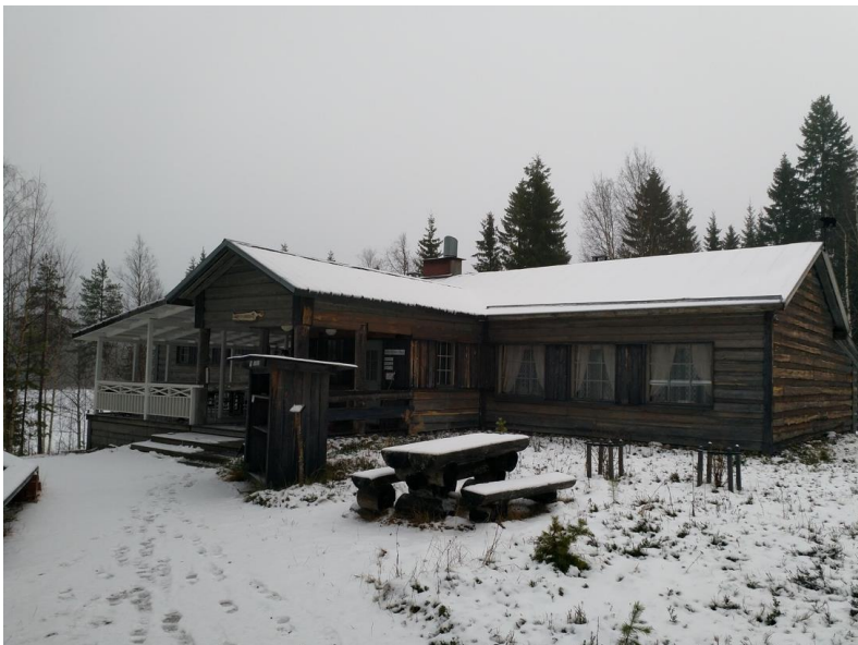
Kuva 5. Vastaanotto(respa), ravintoja, matkamuistomyymälä ja auditorio rakennus.