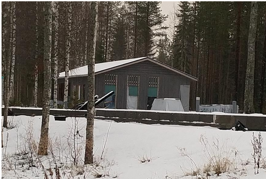
Kuva 7. Huoltorakennus