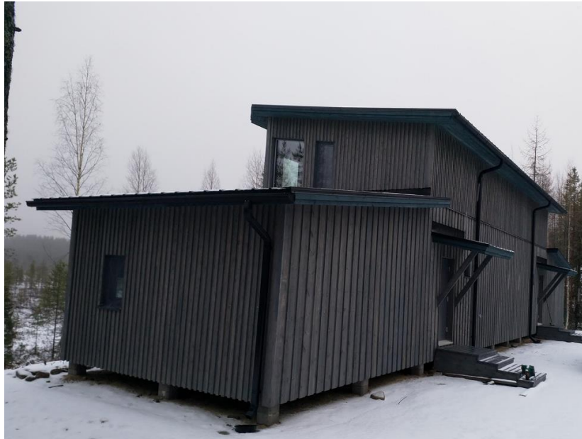
Kuva 10. Karhun katselutalo