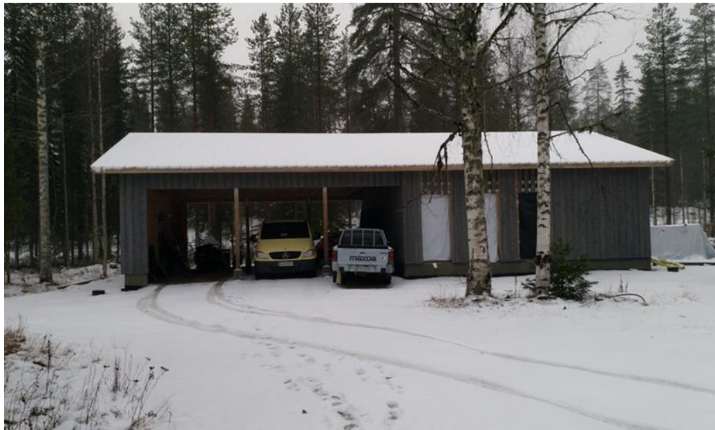
Kuva 6. Autokatos