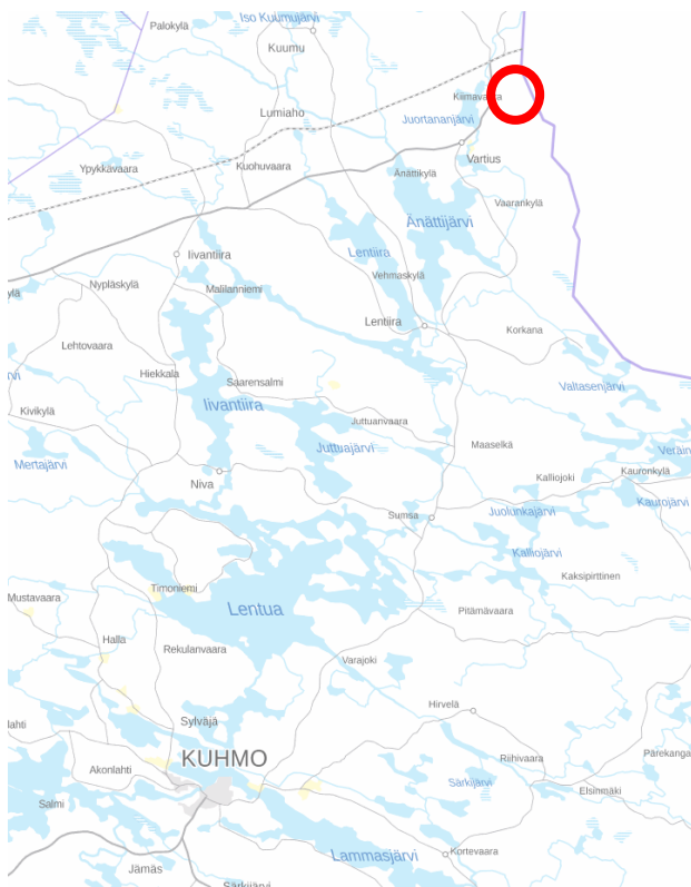
Kuva 1. Suunnittelualueen sijainti (pohjakartta maanmittauslaitos)

Ranta-asemakaava laaditaan Wild Brown Bear Oy:n aloitteesta yhtiön omistamille tiloille sekä metsähallitukselta ostetulle määrälalle. Suunnittelualue sijoittuu Vartiuksen rajanylityspaikan läheisyyteen entisen rajavartioaseman alueelle Erilammen ja läheisten pienten Laukkulampien sekä Aumalampien ympäristöön. Ranta-asemakaava koskee tiloja 290-413-9-14, 290-413-9-15 ja 290-893-11-1 (määräala). Suunnittelualueen pinta-ala noin 44 ha. Suunnittelualueen sijainti ilmenee oheisesta kuvasta 1 ja suunnittelualueen rajaus kuvasta 2.