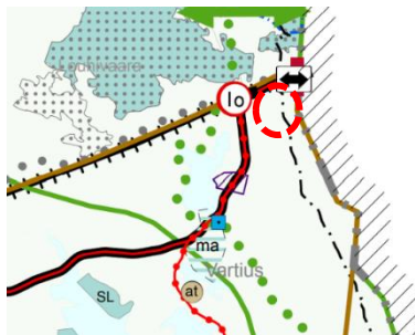
Kuva 11. Ote maakuntakaavayhdistelmästä

Kainuun vaihemaakuntakaavassa 2030 on annettu koko maakuntakaavaa-alueetta koskeva, rantojen käyttöä koskeva yleinen suunnittelumääräys: ”Ranta-alueita tulee kehittää viihtyisinä asumisen ja virkistysalueina huomioon ottaen vapaa-ajan, osa-aika- tai pysyvän asumisen tarpeet. Alueiden suunnittelussa tulee kiinnittää huomiota sähköisten palvelujen saatavuuteen, olemassa olevaan infrastruktuuriin sekä ympärivuotisen käytön edellytyksiin. Yksityiskohtaisemmassa kaavoituksessa tulee ottaa huomioon yleisen virkistyskäytön tarpeet ja vesille pääsyn mahdollisuudet, luonnon- ja maisema-arvot sekä vesi- ja energiahuollon järjestäminen.”